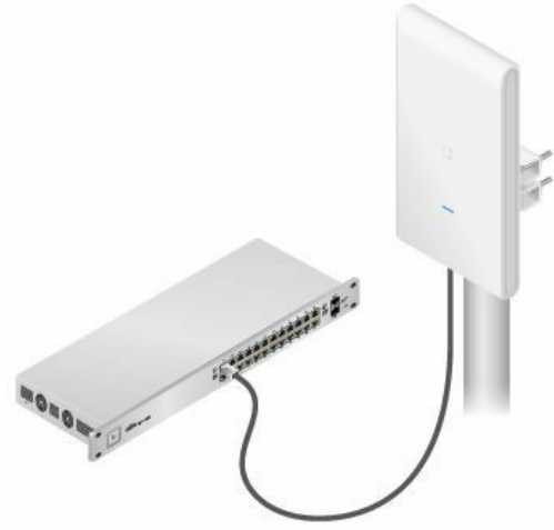
Connected to UniFi Switch, model US-24-250W

Connect the Ethernet cable from the UniFi AP directly to a PoE port on an 802.3af switch. PoE will automatically be enabled.