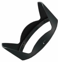
バヨネットフード HB-81