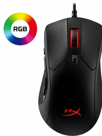
Split-button design for extra responsiveness