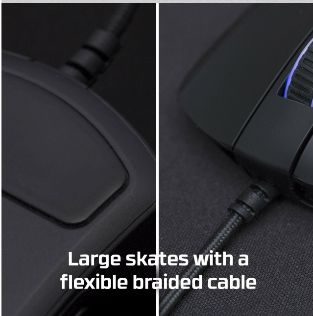
Large skates with a flexible braided cable