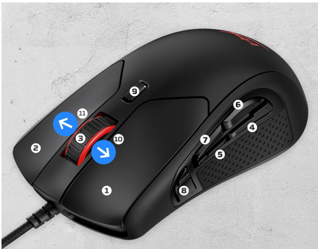
11-button programmable mouse