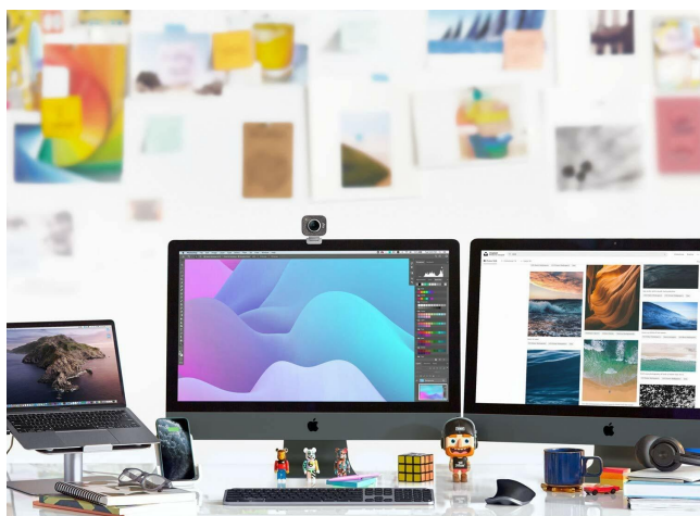
MAC TASTENLAYOUT IN SPACE GRAY