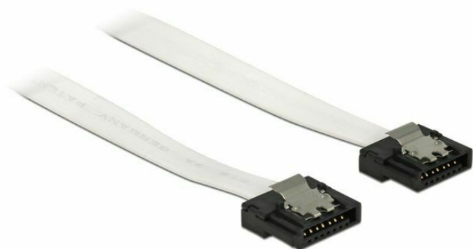
SATA Flexi cable