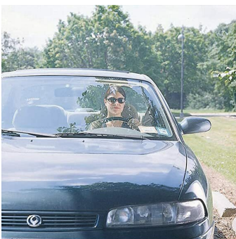
ohne B+W Polfilter HTC Käsemann