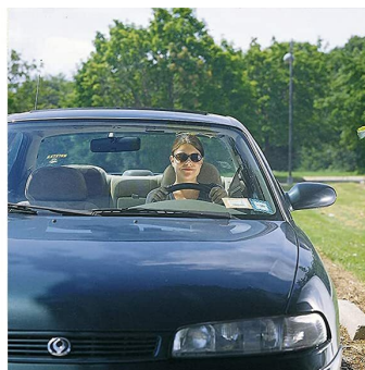
mit B+W Polfilter HTC Käsemann