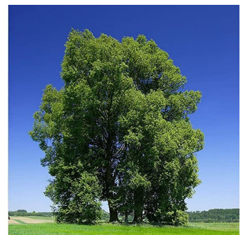
mit B+W Polfilter HTC Käsemann