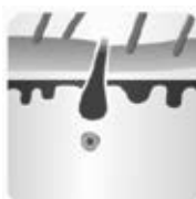
Faza de repaus - telogenă

Epilatorul IPL oferă o epilare sigură și de lungă durată în intimitatea și confortul casei dumneavoastră.