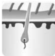
Růstová fáze - anagenní