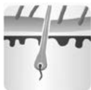
Faza de creștere - anagenă