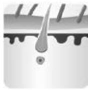
Fase de transición - catágena