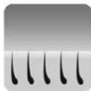
Prima di procedere al trattamento con l'epilatore IPL

La quantità di pigmento nella pelle umana determina non solo il colore, ma anche il livello di rischio al quale l'utente è esposto utilizzando l'epilazione a base di luce in generale. Tanto più scura è la pelle, tanto più grande il rischio è.