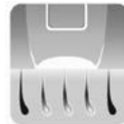
During the pulse emitted by the IPL epilator