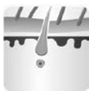
Faza de tranziție - catagenă