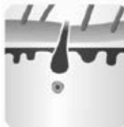
Fase de reposo - catágena

La depiladora IPL ofrece una depilación segura y duradera en la privacidad y comodidad de su hogar.