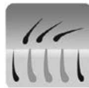
Az IPL epilátorral történő kezelés után