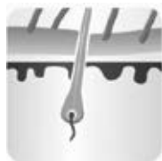
Augšanas fāze – anagēnā