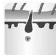
Fase di riposo - telogen

L'epilatore IPL offre l'epilazione sicura e duratura in privato e nella comodità di casa propria.