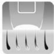
Durante l'impulso di luce emesso dall'epilatore IPL