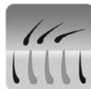
Nach der Behandlung mit dem IPL-Haarent- fernungsgerät