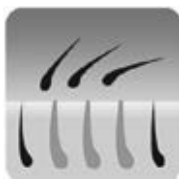
Dopo il trattamento IPL con l'epilatore