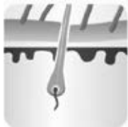
Fase de crecimiento - anágena