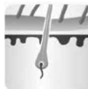
Fase di crescita - anagen