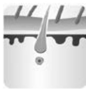
Pārejas posms – katagēnā