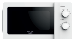
MICROWAVE OVEN AD 6205