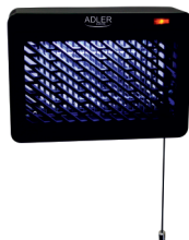
MOSQUITO LAMP AD 7938