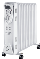
OIL-FILLER RADIATOR AD 7811