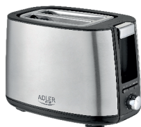
TOASTER 2 SLICE AD 3214