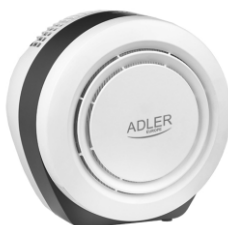
Air Purifier AD 7961