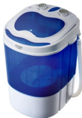
Mini washing machine with spinning function AD 8051