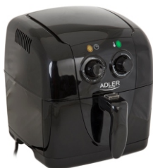
Air fryer AD 6307