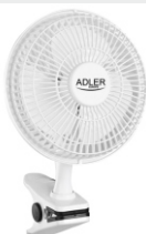
Desk fan 15 cm with clip AD 7317