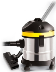
Canister vacuum cleaner AD 7022