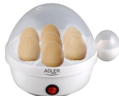
Egg Boiler AD 4459