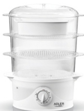
Steam cooker AD 633