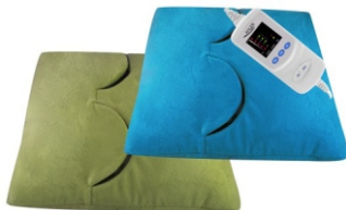
Electric heating pad AD 7403