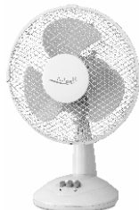
Table Fan AD 7302