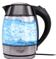
Electric kettle 1.8L AD 1246