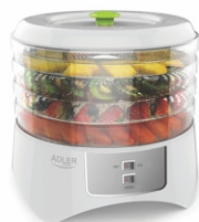
Food dryer AD 6654