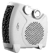
Fan heater AD 77