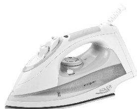
Steam Iron AD 5014