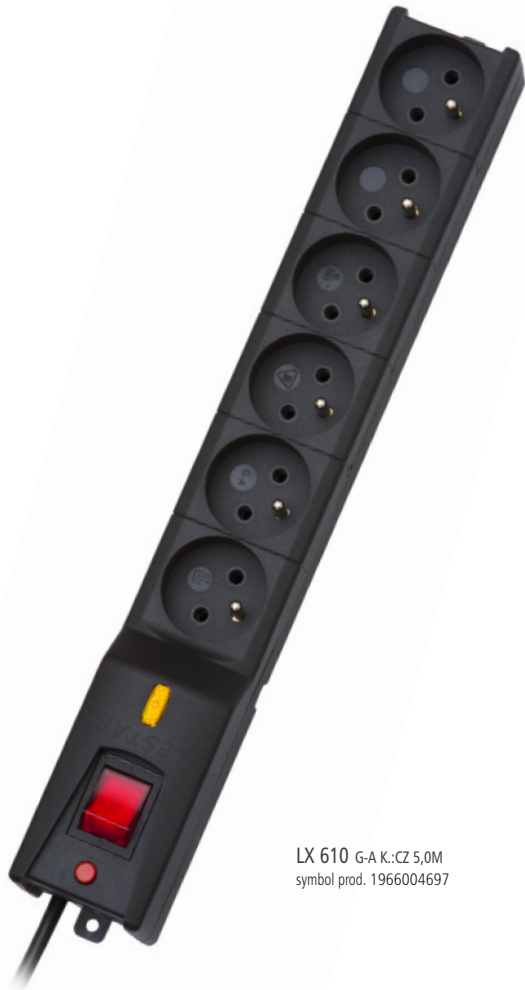
LX 610 G-A K.:CZ 5,0M symbol prod. 1966004697