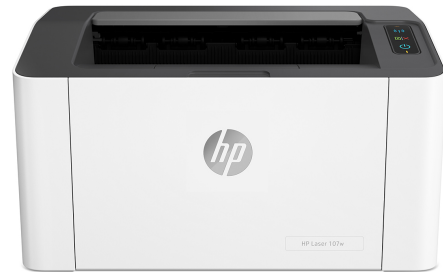
Drukarka laserowa HP 107w

Drukarka korzysta z zabezpieczeń dynamicznych, które mogą być okresowo aktualizowane za pomocą aktualizacji oprogramowania sprzętowego. Drukarka nadaje się do użycia wyłącznie z wkładami drukującymi z oryginalnym układem firmy HP. Wkłady drukujące korzystające z układów innych producentów mogą nie działać lub przestać działać. Więcej informacji: Więcej informacji znajdziesz pod adresem: www.hp.com/learn/ds