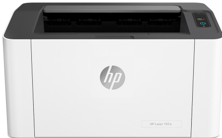
Drukarka laserowa HP 107a

Uzyskaj wysoką wydajność w przystępnej cenie. Wysokiej jakości wyniki oraz drukowanie i skanowanie z telefonu. 1,2