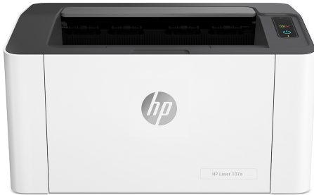
Drukarka laserowa HP 107a

Uzyskaj wysoką wydajność w przystępnej cenie. Wysokiej jakości wyniki oraz drukowanie i skanowanie z telefonu. 1,2