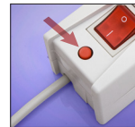
resetowalny bezpiecznik 10A