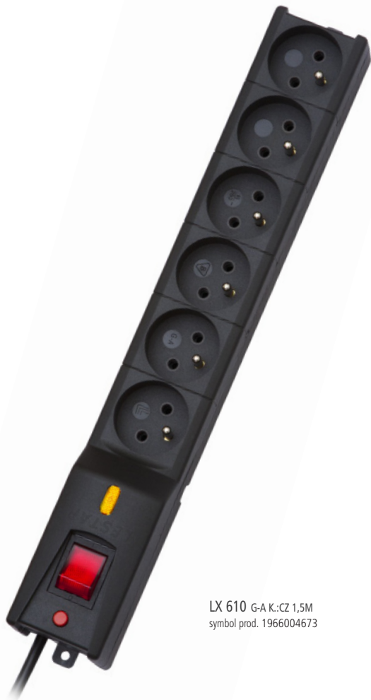
LX 610 G-A K.:CZ 1,5M symbol prod. 1966004673