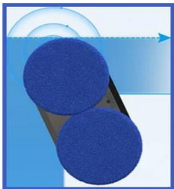
System wykrywania krawędzi