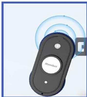
Precyzyjny algorytm i czujniki do wykrywania zaczepów w oknie