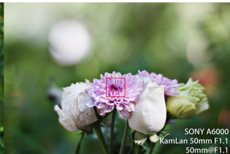
SONY A6000 KamLan 50mm F1.1 50mm@F1.1