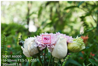
SONY A6000 16-50mm F3.5-5.6 OSS 50mm@F5.6